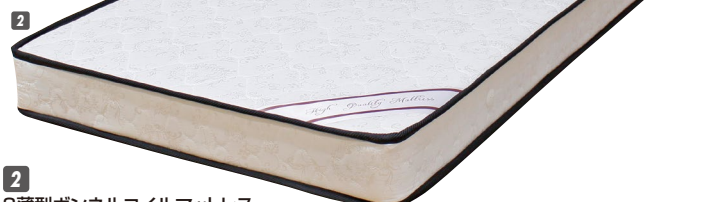
2 S薄型ボンネルコイルマットレス W970×L1950×H130 (コイル数270) ¥26,000 才数9