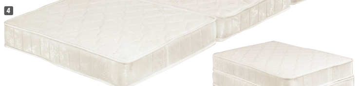
4 ボンネルミツ折マット W970×L1950×H130 ¥30,700 才数11