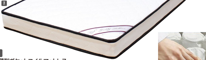
1 S薄型ポケットコイルマットレス W970×L1950×H130 (コイル数450) ¥43,000 才数9