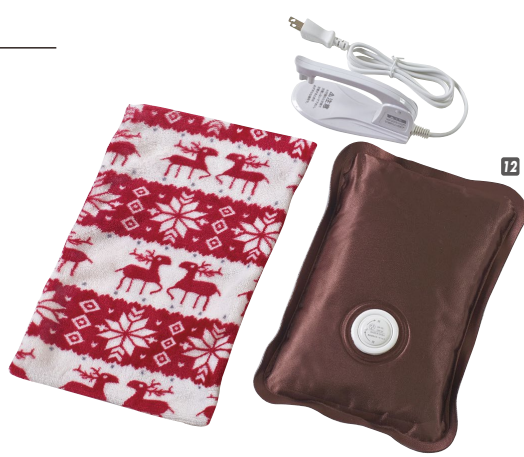
12 湯たんぽ W270×D65×H200 カートンサイズ:W475×D295×H420(12個入) ¥60,000(1個 ¥5,000) 才数3