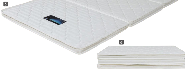
5 Sミツ折マットレス W970×L1950×H60 ¥25,000 才数5 6 SSミツ折マットレス W900×L1800×H60 ¥24,400 才数4