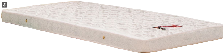
3 薄型Sマットレス W970×L1950×H110 (コイル数279) ¥33,700 才数8