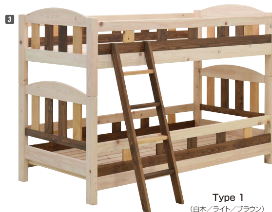
Type 1 (白木 / ライト / ブラウン)