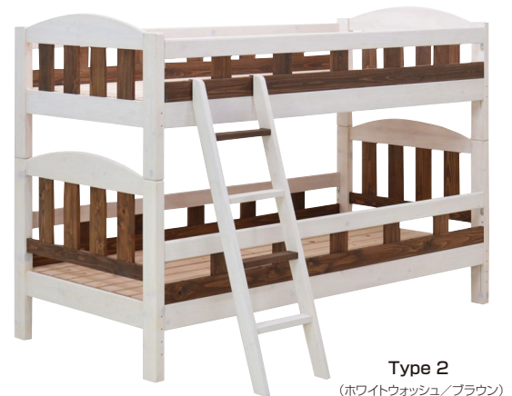
Type 2 (ホワイトウォッシュ / ブラウン)