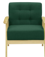
(グリーン/ナチュラル)