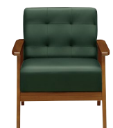
(ダークグリーン/ブラウン)