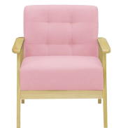
(ピンク/ナチュラル)