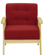
(レッド/ナチュラル)