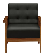
(ブラック/ブラウン)