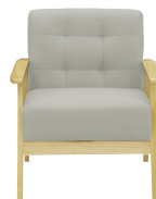
(グレー/ナチュラル)