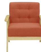
(オレンジ/ナチュラル)