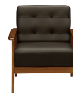
(ダークブラウン/ブラウン)