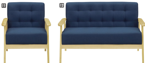
(ブルー/ナチュラル)