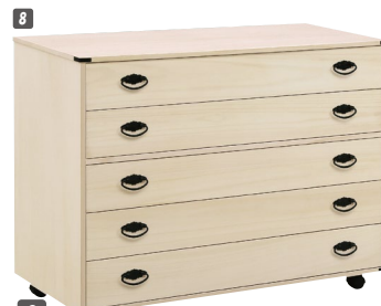
8 総桐衣装チェスト(650BS)5段 W1000×D440×H760 ¥75,000 才数14