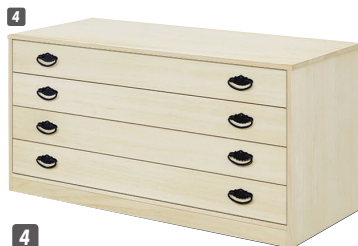
4 総桐チェスト(T0-4)100-4 W1000×D440×H500 ¥58,700 才数10