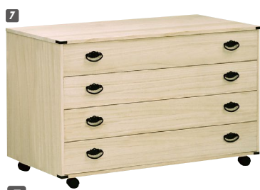
7 総桐衣装チェスト(650B)4段 W1000×D440×H615 ¥63,700 才数11