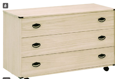
6 総桐衣装チェスト(650A)3段 W1000×D440×H615 ¥59,400 才数11