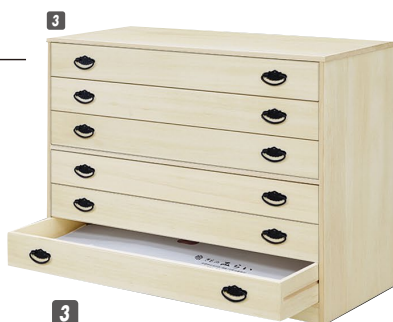
3 総桐チェスト(T0-6)100-6 W1000×D440×H720 ¥76,000 才数14