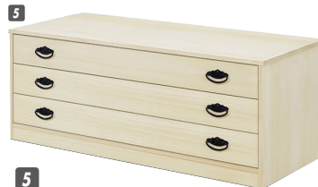
5 総桐チェスト(T0-3)100-3 W1000×D440×H390 ¥44,700 才数8