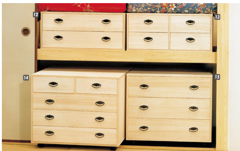
15 桐押入タンス(ROT-3)75-3 W750×D750×H650 ¥73,700 才数14