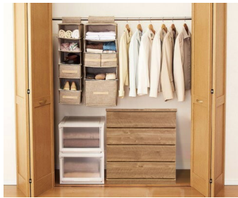
クローゼット下にはチェスト奥浅