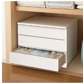
押し入れ下にはチェスト奥深(スライドレール付)

7 チェスト60-4(奥浅) W595×D400×H859 ¥62,000 才数8