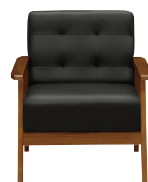
(ブラック/ブラウン)