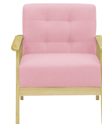
(ピンク/ナチュラル)