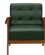
(ダークグリーン/ブラウン)