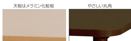
天板はメラミン化粧板