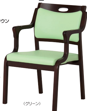
フレーム:ブラウン