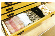
ショールやマフラーなどもシワになりにくい状態で収納

●着物のたとう紙が収納できるサイズ設計 ●引出し材には保管に最適な桐材を使用しております ●日本製