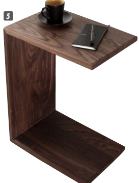
5 サイドテーブル45 W450×D300×H600 ¥97,750 才数3