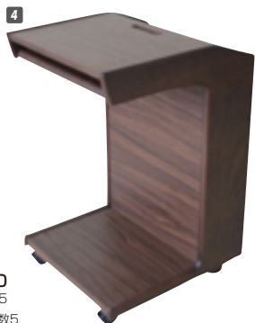
4 サイドテーブル40 W400×D420×H635 ¥60,700 才数5