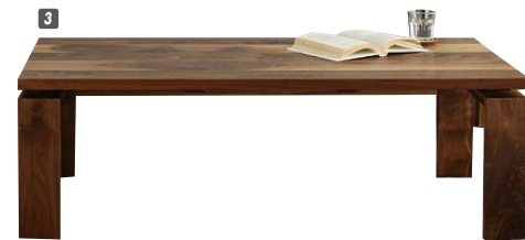
3 センターテーブル120 W1200×D600×H405 ¥208,400 才数11(2ヶ口)