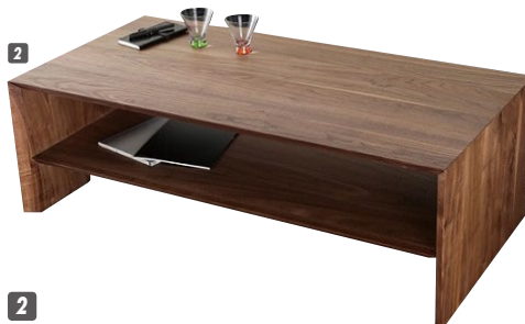
2 センターテーブル120 W1200×D600×H400 ¥208,400 才数11