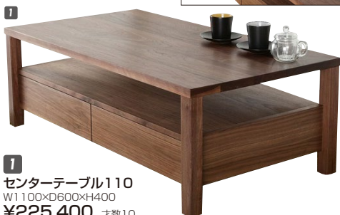
1 センターテーブル110 W1100×D600×H400 ¥225,400 才数10