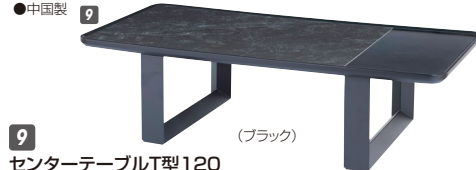
9 センターテーブルLT型120 W1200×D600×H320 ¥74,000 才数4(2ヶ口)