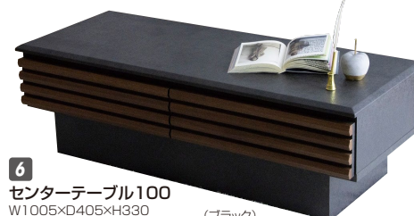
6 センターテーブル100 W1005×D405×H330 ¥45,300 才数6