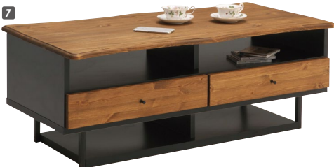
7 センターテーブル105 W1050×D600×H445 ¥61,700 才数11