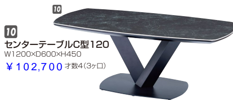
10 センターテーブルC型120 W1200×D600×H450 ¥102,700 才数4(3ヶ口)