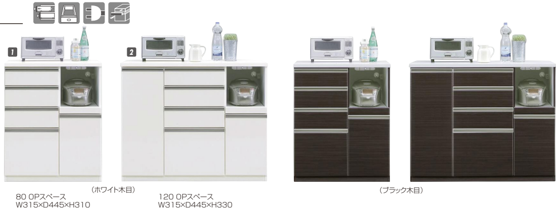
80 OPスペース W315×D445×H310 (ホワイト木目)