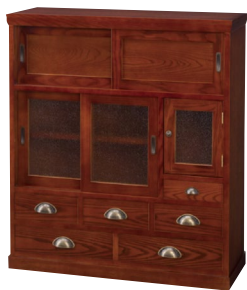
1 (ケヤキ色) 和茶棚 W790×D300×H900 ¥206,000 才数11