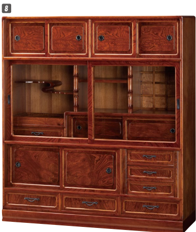
8 和茶棚 W1210×D390×H1350 ¥483,000 才数27