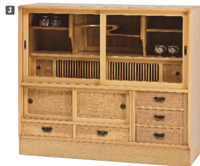
3 和茶棚 W1210×D410×H1030 ¥333,700 才数21