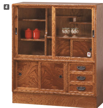
4 和茶棚 W790×D300×H900 ¥141,700 才数8