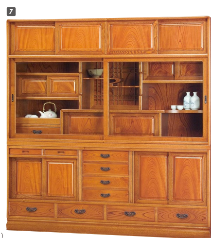
7 和茶棚 W1670×D430×H1780 ¥1,121,400 才数57(2ヶ口)