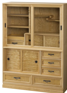
2 (ナチュラル) 和茶棚 W920×D300×H1250 ¥299,700 才数17