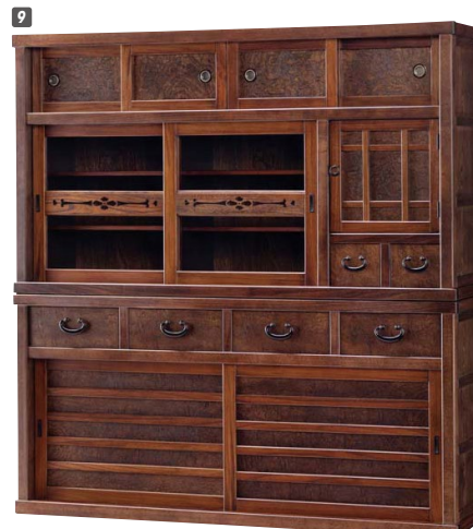
9 水屋 W1670×D430×H1750 ¥924,000 才数57(2ヶ口)