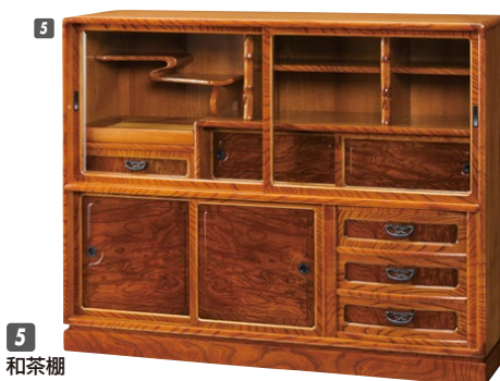
5 和茶棚 W1350×D420×H1070 ¥406,700 才数27