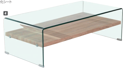
4 ガラステーブル110 W1100×D550×H350 ¥56,000 才数12(2ヶ口)