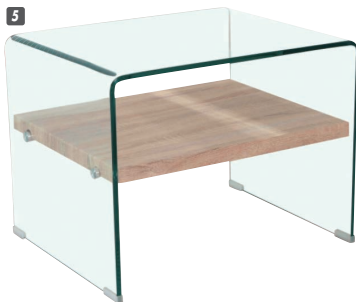
5 ガラステーブル63 W630×D500×H480 ¥49,400 才数5(2ヶ口)