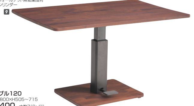
9 昇降テーブル120 W1200×D800×H505~715 ¥110,400 才数7(2ヶ口)