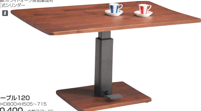
8 昇降テーブル120 W1200×D800×H505~715 ¥110,400 才数7(2ヶ口)