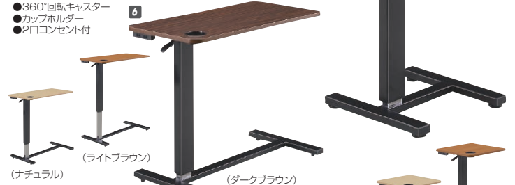
6 昇降テーブル80(DW-1208) W800×D400×H650~950 ¥36,000 才数2