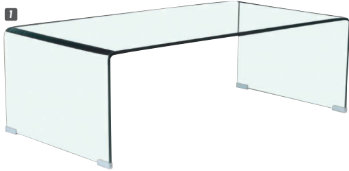
1 ガラステーブル110 W1100×D550×H350 ¥38,000 才数10