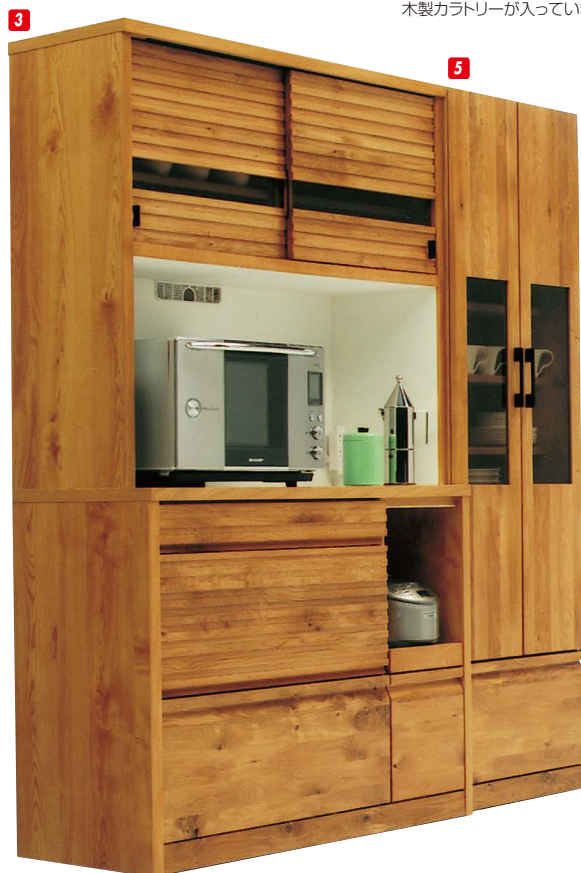
3 オープンボード120 W1200×D470×H1950 ¥306,400 才数41

●オプションバー カウンターの中段引出しには、10本のボールが付いています。開閉時に食器等がぶつかり合うのを防ぎます。ボールの位置も調整可能です。