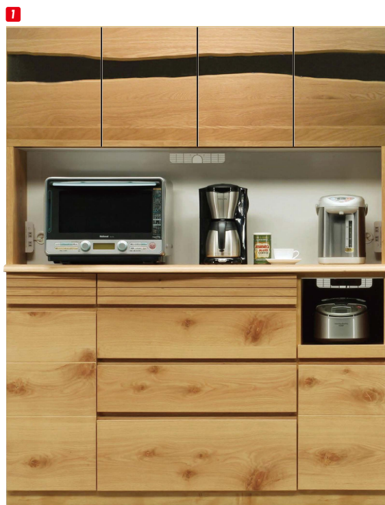
1 オープンボード150 W1500×D472×H1950 ¥439,400 才数51

120 OPスペース 上:W1147×D457×H490 下:W345×D385×H281