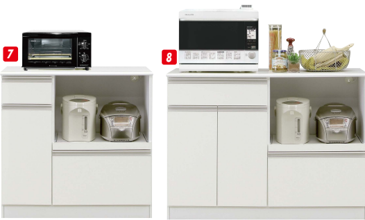
90 OPスペース W520×D370×H400