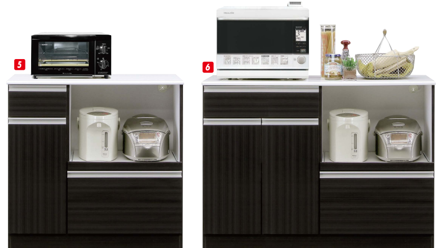
5 7 カウンター90 W890×D430×H870 ¥42,400 才数13