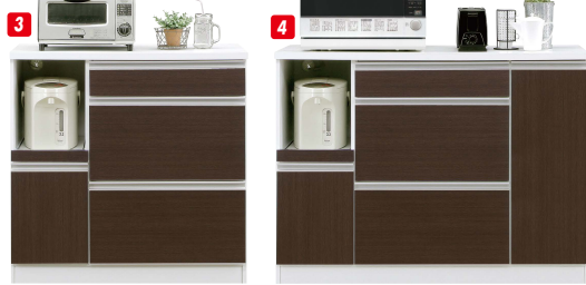
90 OPスペース W235×D350×H340