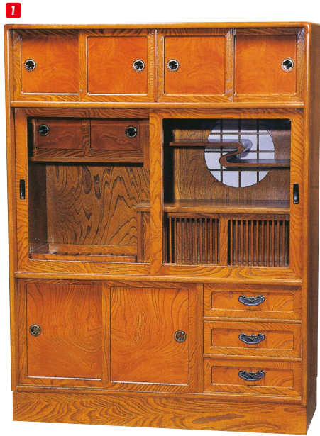
1 和茶棚 W910×D370×H1210 ¥262,700 才数15