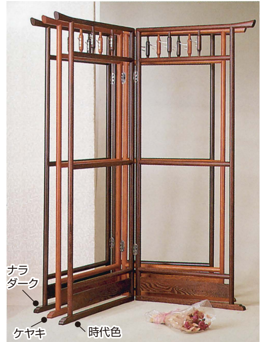
7 カラー/ナラダーク色 並型5823 W750(2枚)×H1500 ¥57,000 才数1