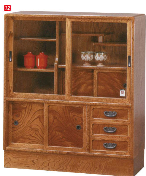
12 和茶棚 W790×D300×H900 ¥134,700 才数8