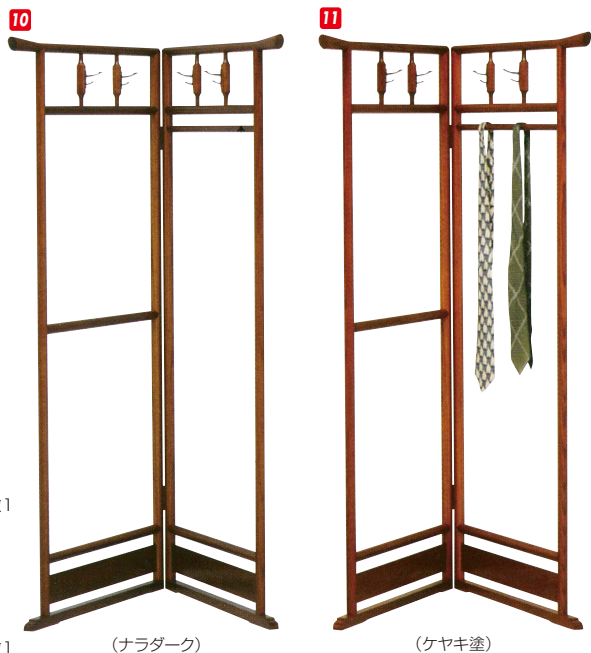
10 衣桁5828 W740(2枚)×H1510 ¥57,000 才数1