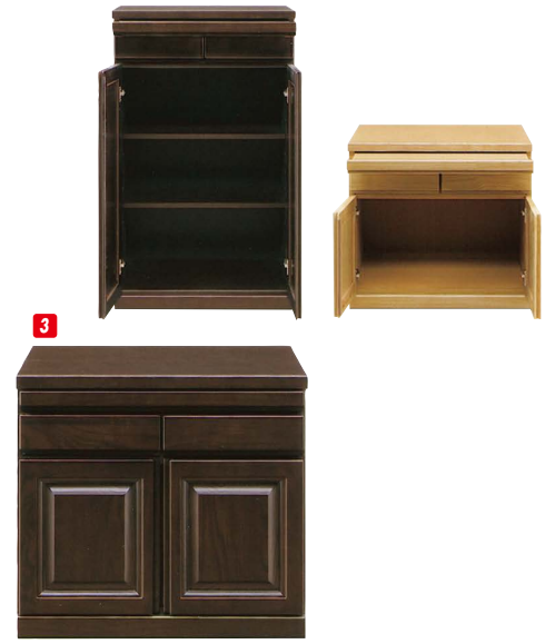
2 仏壇台60(M) W600×D450×H1000 ¥60,000 才数10