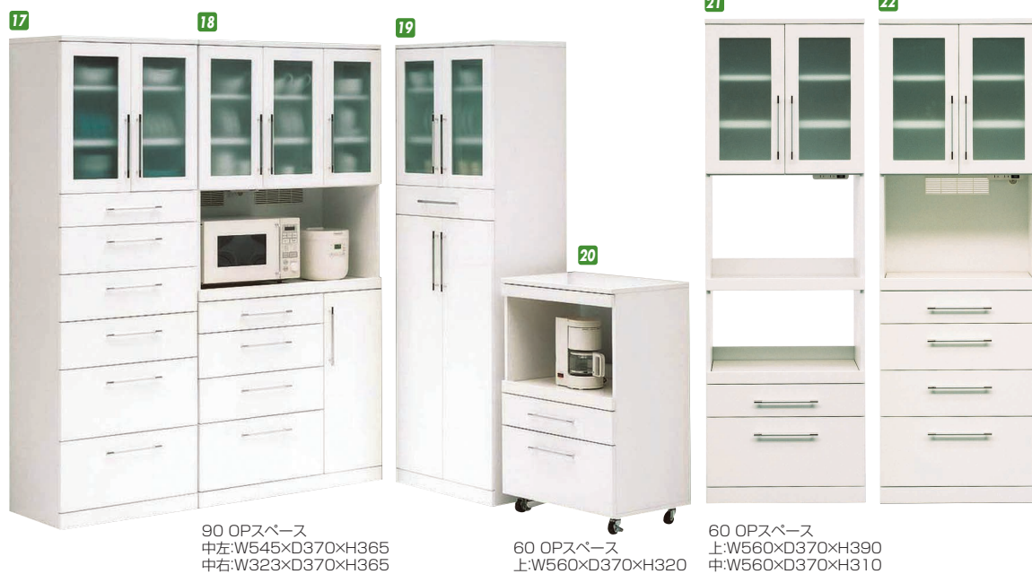
90 OPスペース 中左:W545×D370×H365 中右:W323×D370×H365

22 オープンボード60 W600×D410×H1820 ¥86,700 才数17