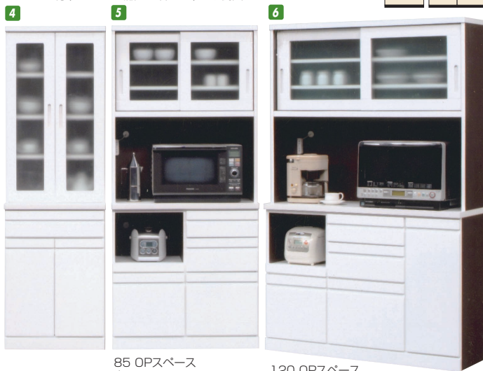
85 OPスペース 上:W805×D425×H495 下:W390×D405×H290