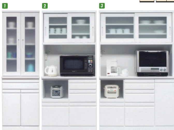
85 OPスペース 上:W805×D425×H495 下:W390×D405×H290