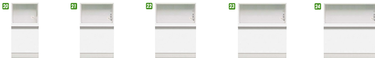
20 下台オープン40 W400×D490×H820 ¥61,400 才数6 21 下台オープン50 ※オ W500×D490×H820 ¥68,700 才数8 22 下台オープン60 W600×D490×H820 ¥68,700 才数9 23 下台オープン70 ※オ W700×D490×H820 ¥77,000 才数11 24 下台オープン80 ※オ W800×D490×H820 ¥80,000 才数12