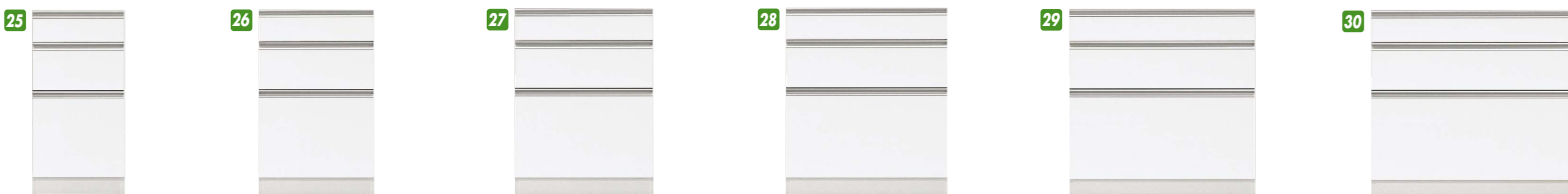
25 下台引出し40 W400×D490×H820 ¥121,400 才数6 26 下台引出し50 ※オ W500×D490×H820 ¥61,400 才数8 27 下台引出し60 W600×D490×H820 ¥68,700 才数9 28 下台引出し70 ※オ W700×D490×H820 ¥68,700 才数11 29 下台引出し80 W800×D490×H820 ¥77,000 才数12 30 下台引出し90 W900×D490×H820 ¥80,000 才数14