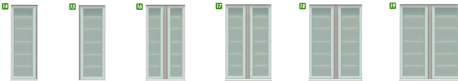
14 上台食器棚40(左) W400×D500×H1180 ¥67,000 才数9 15 上台食器棚40(右) W400×D500×H1180 ¥67,000 才数9 16 上台食器棚60 W600×D500×H1180 ¥104,700 才数14 17 上台食器棚70 ※オ W700×D500×H1180 ¥110,000 才数16 18 上台食器棚80 W800×D500×H1180 ¥120,400 才数18 19 上台食器棚90 ※オ W900×D500×H1180 ¥125,700 才数20