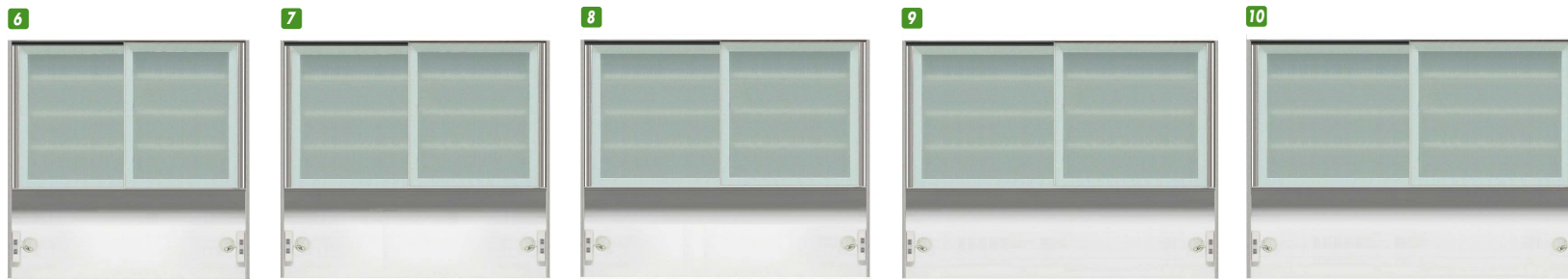
6 上台オープン110 ※オ W1100×D500×H1180 ¥142,400 才数25 7 上台オープン120 W1200×D500×H1180 ¥142,400 才数27 8 上台オープン130 ※オ W1300×D500×H1180 ¥165,400 才数29 9 上台オープン140 W1400×D500×H1180 ¥165,400 才数31 10 上台オープン150 ※オ W1500×D500×H1180 ¥183,700 才数33