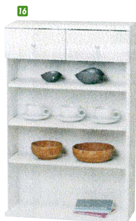
16 薄型ラック(S) W590×D240×H850 ¥14,000 才数2