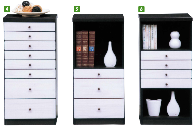
4 チェスト40A W400×D300×H850 ¥37,400 才数4