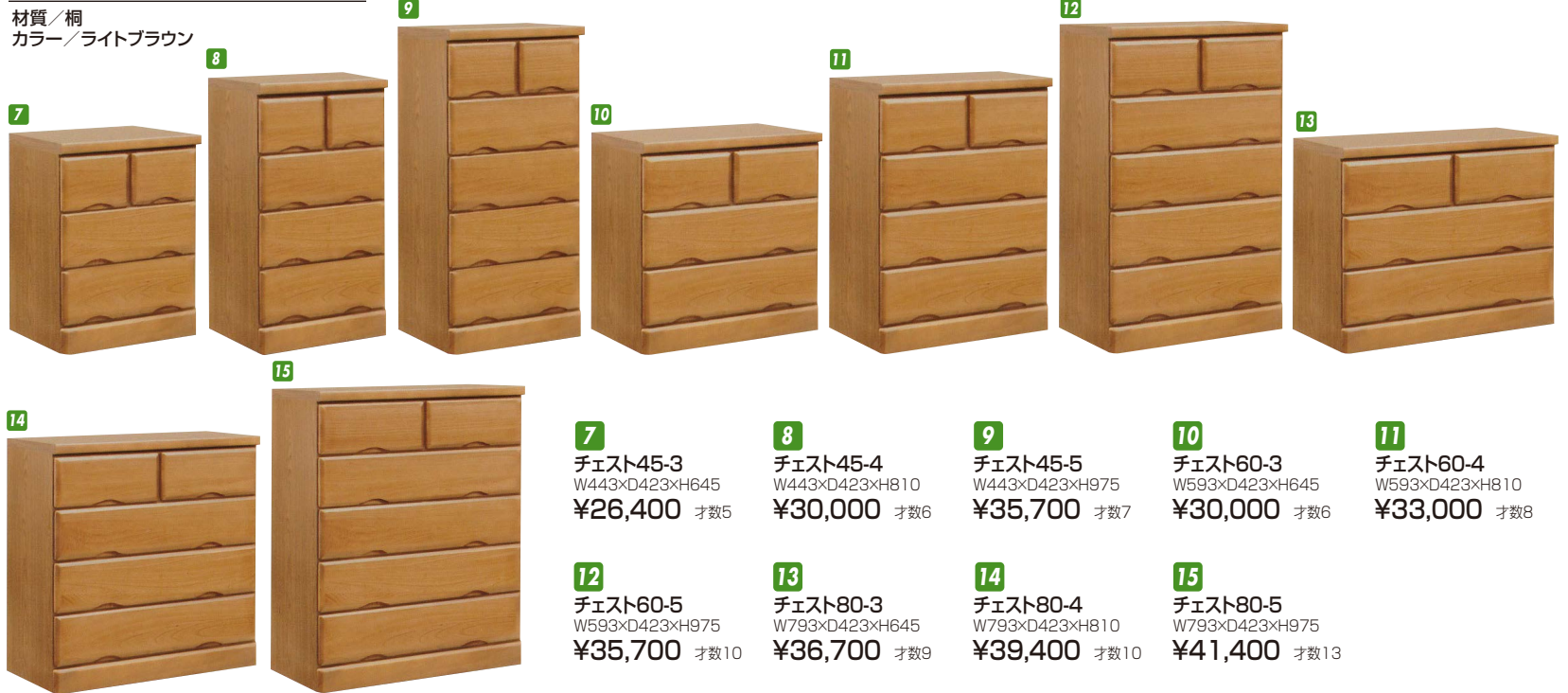
7 チェスト45-3 W443×D423×H645 ¥26,400 才数5