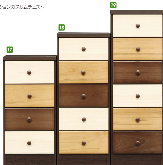
17 スリムチェスト40-4 W390×D395×H800 ¥18,700 才数5